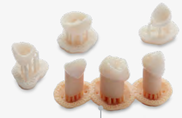
18 min Mehr als 100 Kronen

Vereinfachte Zahnmedizin durch innovative Lösungen.