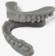
9 min 11 Aligner-Modelle