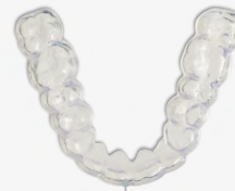
49 min 8 Schienen